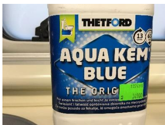
Rozkladová chemie- příklad

Před prvním použitím je nutné nalít do toalety rozkladovou chemii. Ta zajišťuje rozložení obsahu. Nalijte přibližně 1 dl nebo vložte 1 tabletu a spláchněte cca 2 lt. vody. Splachovadlo je zde. Pozor, musí být zapnuté čerpadlo. Před použitím toalety je nutné otevřít záklopku pákou pod mísou. Pozor! Vždy zase zavírat. Pod splachovadlem je i signalizace naplnění kazety.